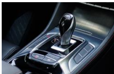
7-stupanjski automatski DCT mjenjač kao opcija na Comfort i Luxury