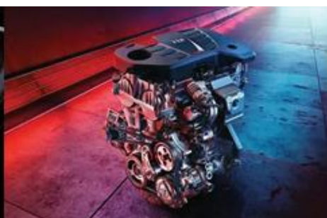
Snažan motor 1.5T GDI s izravnim ubrizgavanjem goriva osigurava snagu od 162 KS